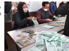
皆様のご厚意で集まった多額の募金を会計中心で必死に整理中