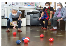
なかいちサロン（※2）はお茶や合唱やポッチャなどを楽しむ無料サロン