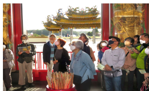
秋晴れの中、久々の懇親バス・ツアー