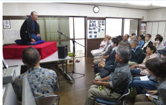
毎回回しのある真打さんによる『なかいち落語会』は、捧腹絶倒！！やはり、ホンモノ＆ナマは凄い！！！！