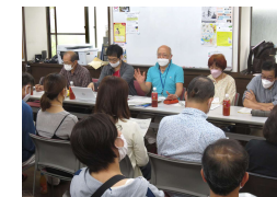
4年ぶりの総会は対面で無事開催