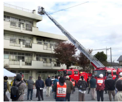
4年ぶりの防災訓練、はしご車による校舎屋上からの救出に驚き、AED操作、煙蔓延の歩行体験等を学習、最後は食料物資班によるカレーライスを小中学生たちと一緒に爆食！！美味しかった・・・